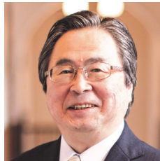
同志社女子大学 学長 加賀 裕郎 (かが ひろお)

京都大学大学院文学研究科宗教学 (仏教学) 専攻博士課程単位取得満期退学、文学博士、2007 年 4 月より現職、専門はインド仏教学、主な著書に『中観莊嚴論の研究—シャーンタラクシタの思想』(文栄堂、1985 年) 他