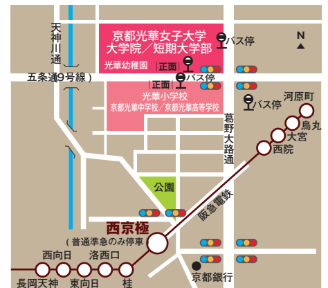
●阪急電車「西京極駅」下車、徒歩約7分